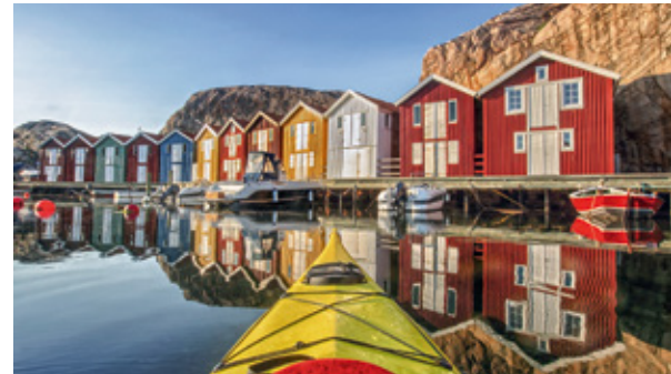
Boothäuser in Smögen, einer kleinen Insel an der Westküste Schwedens.

Familiäre Atmosphäre, kulinarische Genüsse mit regionalen Produkten und vor allem der persönliche Kontakt zu den Gastgebern, die ihre Häuser individuell führen und sich Zeit für ihre Gäste nehmen – das sind die wesentlichen Vorzüge eines Ringhotels. Auch die privat geführten Hotels der „ Global Alliance of Private Hotels “, ein Zusammenschluss des Ringhotels e.V. mit sechs Kooperationspartnern, bieten Ihnen diese Vorzüge. Erleben Sie Privathotellerie weltweit, vom hohen Norden bis in die Karibik und nach Australien. Mehr Informationen zu unseren Partnern erhalten Sie unter ringhotels.de/privathotels-weltweit .