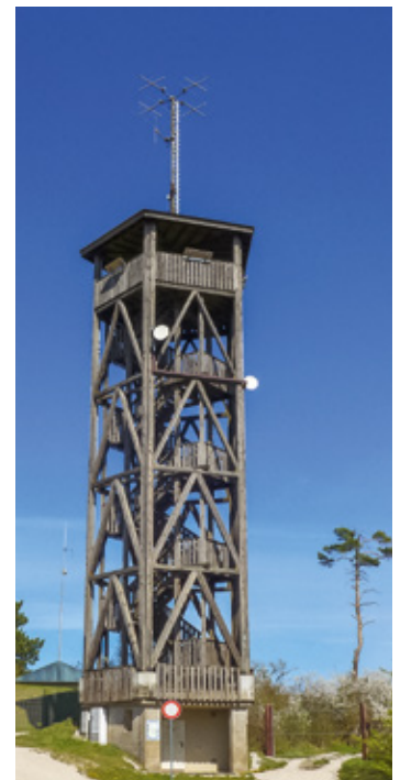
Dieser Aussichtsturm steht auf der Hohenmirsberger Platte.

Eine besonders für Geologie-interessierte Ausflügler sehr schöne Tagesrundwanderung startet in dem recht zentral im Naturpark gelegenen Ort Pottenstein. Vom Parkplatz in der Ortsmitte aus startend geht man zunächst im Uhrzeigersinn –in nördlicher Richtung. Der Wanderweg führt dabei durch das Haselbrunnbachtal vorbei an der Mariengrotte nach Haselbrunn und über die Trockenrasenhänge nördlich des Ortes bis nach Hohenmirsberg. Dort läuft man zum Aussichtsturm auf der Hohenmirsberger Platte. Der bietet mit 614 Metern eine der höchsten Erhebungen der Fränkischen Schweiz und einen herrlichen Panoramablick.