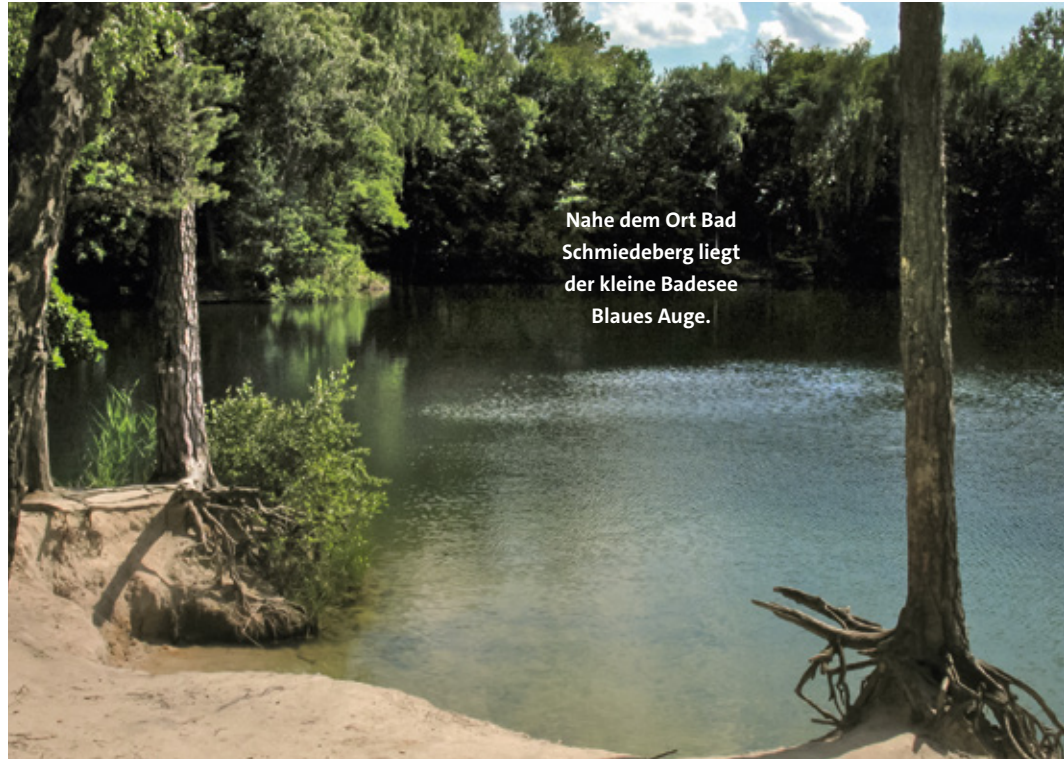
Nahe dem Ort Bad Schmiedeberg liegt der kleine Badesee Blaues Auge .

Die Strecke ist keine Rundtour, doch Start- und Zielpunkt sind sehr gut mit Bus und Bahn für An- und Rückfahrt verbunden. Vom Ringhotel Zum Stein in Wörlitz gelangt man in 20 Minuten Autofahrt nach Gräfenhainichen am nördlichen Rand des Naturparks, etwa doppelt so lang dauert es nach Bad Schmiedeberg und Bad Düben. Die am westlichen und südlichen Rand des Naturparks gelegenen Orte Bad Düben und Eilenburg erreicht man mit dem Auto vom Ringhotel Jägerhof in Weißenfels aus in einer Stunde Fahrtzeit.