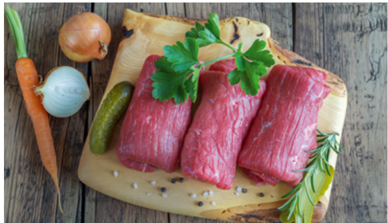
Zwiebeln, Gewürzgerurken und weitere Zutaten für die Füllung der Rinderrouladen.

Die Frage nach dem Rotwein, der für die Zubereitung von Rinderrouladen besonders gut passt, ist leicht zu beantworten. Alle Rezepte gleichen sich darin, dass sie kräftig ge-