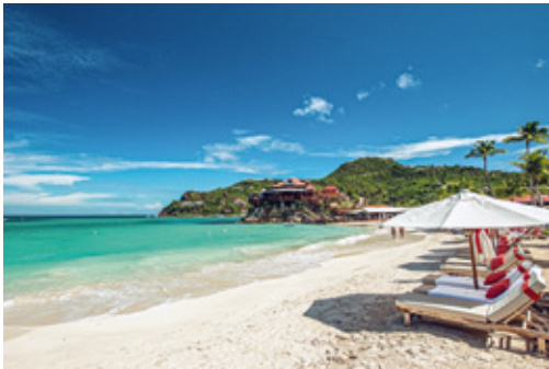
Die Französischen Antillen gehören zu den Traumzielen in der Karibik.

Genießen Sie die zahlreichen Vorzüge der Ringhotels auch mit unseren Partnern. Mehr als 1.100 Hotels in über 80 Ländern weltweit.