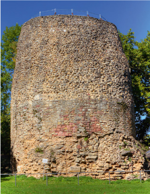
Der 20 Meter hohe Drususstein auf dem Jakobsberg am Rand der Mainzer Altstadt ist mehr als 2000 Jahre alt.

Roms Herrschaft, und die Franken übernahmen die Stadt. Ihr Übergang zum Christentum leitete den Aufstieg von Mainz zur Bischofsstadt ein.