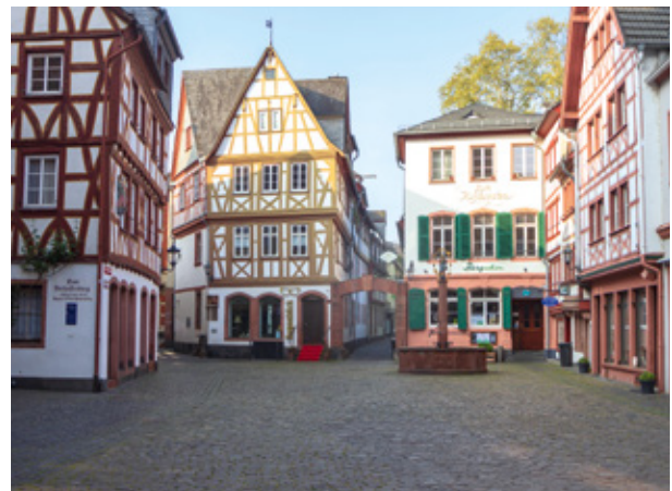
Am Kirchgarten stehen die ältesten Fachwerkhäuser von Mainz.

Doch wann wurde die Stadt gegründet und woher stammt der Name Mainz? Die Kelten siedelten rund 500 Jahre vor Christi Geburt am Rhein und beteten eine Gottheit namens Mogon an. Als die Römer nach der Eroberung Galliens zum Rhein vormarschierten und ihr Heerführer Drusus