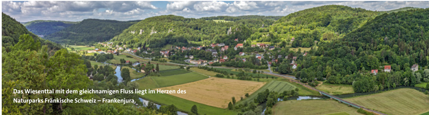
Das Wiesenttal mit dem gleichnamigen Fluss liegt im Herzen des Naturparks Fränkische Schweiz – Frankenjura.