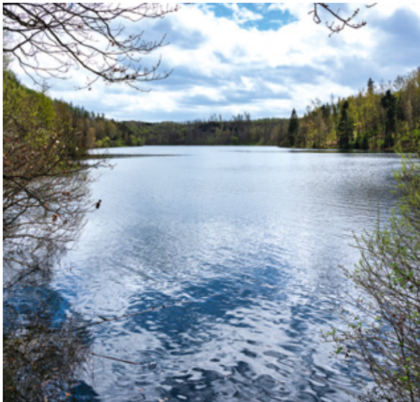
Der Stausee Wippra lässt sich schön umwandern, er kann aber auch Teil einer längeren Wanderstrecke von Wippra aus werden.

macht. Der folgt man und gelangt durch das obere Püttlachtal zurück nach Pottenstein. Der Ort, von dem diese Wanderung aus startet, ist sowohl vom Ringhotel Loew's Merkur in Nürnberg als auch vom Ringhotel Reubel garni in Nürnberg-Zirndorf in jeweils einer Stunde Fahrtzeit mit dem Auto erreichbar.