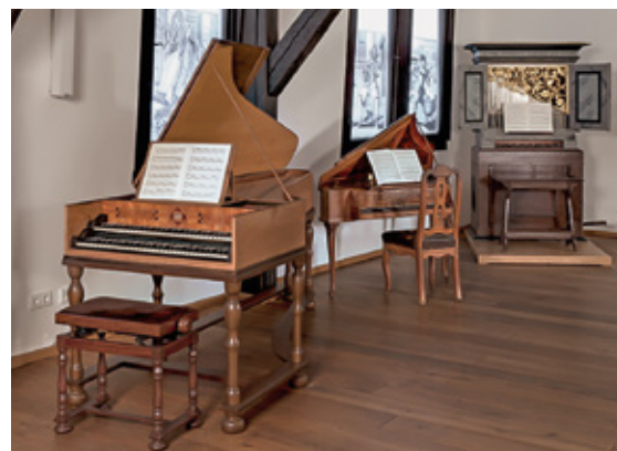
Der Instrumentensaal im Eisenacher Museum zeigt eine Reihe von Originalbauwerken aus der Zeit des Barocks.

Der Besuch des täglich von 10 bis 18 Uhr geöffneten Geburtshauses sowie des daneben stehenden Museums für Johann Sebastian Bach ist vom Ringhotel Lutherhotel Eisenacher Hof sogar zu Fuß aus möglich. In weniger als einer Viertelstunde hat man den etwas mehr als einen Kilometer langen Weg durch das Stadtzentrum zurückgelegt. Auf dem Museumsgelände sind übrigens auch der barocke Garten und das „Café Kantate“ einen Besuch wert.