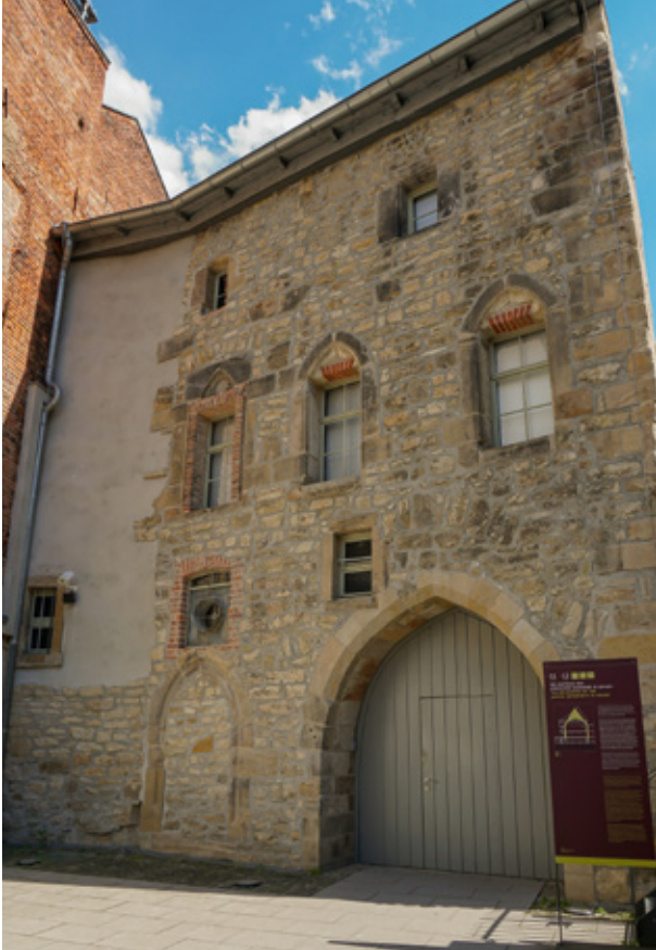
Der Blick auf die Nordfassade der Alten Synagoge in Erfurt, die nach dem mörderischen Pogrom gegen die Juden von 1349 anders genutzt wurde und in Vergessenheit geriet.

wänden. Eine Projektion zeigt im gedämmten Licht, wo einst der Thoraschrein stand.