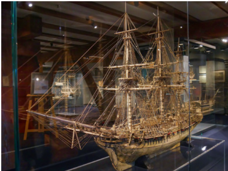
Auf dem achten Deck befindet sich in der „Schatzkammer“ das aus Tierknochen gefertigte Schiffsmodell der „Chesapeake“, einem der ersten US-Marinschiffe.

und anderen historischen Navigationsgeräten auskennen, von denen etliche zu sehen sind. Wer dagegen schon immer einmal selbst ausprobieren wollte, wie ein modernes Container- oder Kreuzfahrtschiff in den Hafen von Hamburg, Rotterdam oder Singapur zu steuern ist, hat im High-Tech-Schiffssimulator die Gelegenheit dazu.