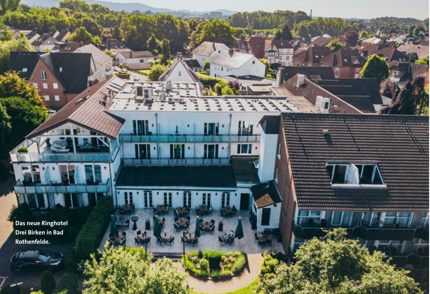
Das neue Ringhotel Drei Birken in Bad Rothenfelde.