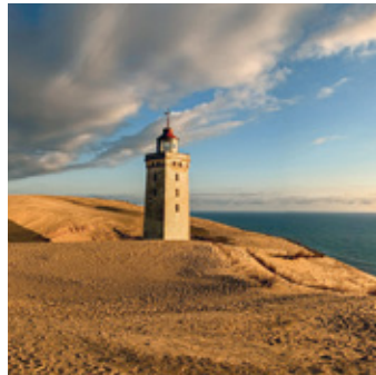
Düne und Leuchtturm von Rubjerg Knude im Norden Dänemarks.