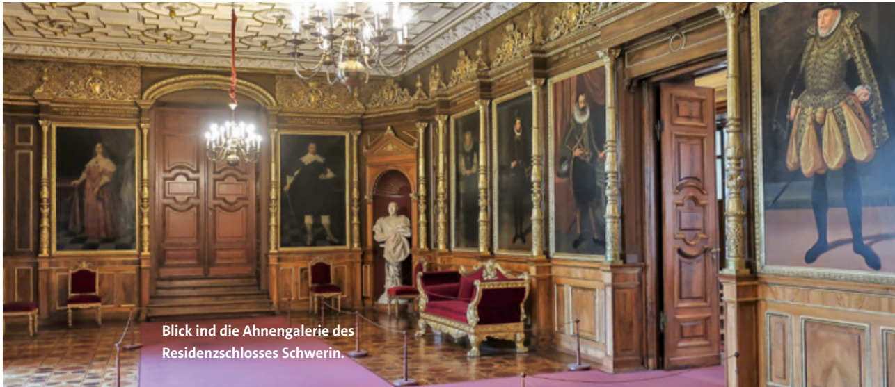
Blick ind die Ahnengalerie des Residenzschlosses Schwerin.

Das Welterbekomitee der UNESCO nimmt nur Objekte von außergewöhnlichem und universellem Wert in die Welterbeliste auf. Dabei handelt es sich um Kulturgüter, Naturstätten oder um Stätten, die sowohl dem Kultur- als auch dem Naturerbe angehören. Bis heute wurden weltweit mehr als 1.100 Stätten in diese Liste aufgenommen. Das heißt, dass sie über eine Bedeutung für die Kultur beziehungsweise die Natur verfügen, die über die Landesgrenzen hinausgeht. Darüber hinaus müssen sie einen unschätzbaren Wert für die gegenwärtigen und kommenden Generationen der Menschheit darstellen.