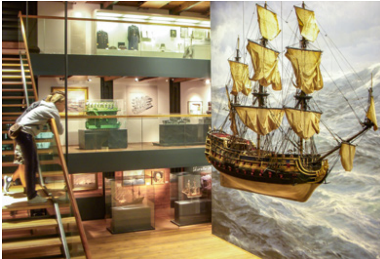
Auf der Höhe des dritten Decks, das dem Schiffsbau gewidmet ist, sieht man ein große Modell dieses Segelmarineschiffs vor dem Bild mit hohen Atlantikwellen.