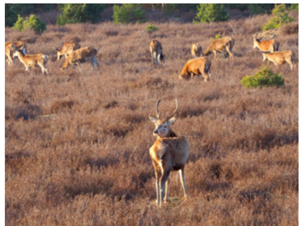
Bei der Wanderung durch die Schönower Heide im Naturpark Barnim lassen sich recht oft Wildtiere beobachten.

In dieser abwechslungsreichen Landschaft liegen Orte, in denen Reste slawischer und deutscher Burgen von der Geschichte des Barnims zeugen. Dazu gehören beeindruckende und mit alter Handwerkskunst erstellte Feld- und Ziegelsteinbauten sowie historische Wasserstraßen wie der Finowkanal.