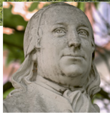
Graf Nikolaus Ludwig von Zinzendorf (1700 bis 1760) gründete in jungen Jahren die Herrnhuter Brüdergemeinde.

Der Kirchensaal strahlt schlichte Eleganz aus und verbindet damit die Frömmigkeit mit der adeligen Abstammung Zinzendorfs. Die Wände und die verschiebbaren Bänke sind in strahlendem Weiß gehalten, der Boden aus Weißtanne gefertigt. Der Adelige legte sogar eigene Maßeinheiten fest, die die Religionsgemeinschaft bis heute weltweit miteinander verbinden. So passen Türen aus dem 1721 gebauten Berthelsdorfer Schloss, das nur zwei Kilometer vom Zentrum der Stadt entfernt liegt, problemlos in die Gebäude der Herrnhuter Gemeinden in den USA und im nordirischen Gracehill. Deshalb umfasst das jüngst auf-