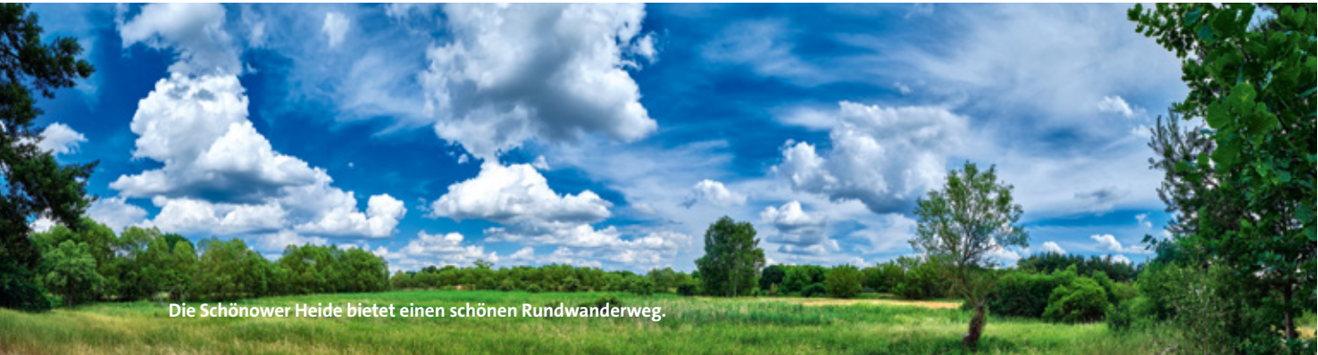
Die Schönower Heide bietet einen schönen Rundwanderweg.

Ein schöner Rundwanderweg durch die Schönower Heide beginnt am nördlich von Berlin gelegenen S-Bahnhof Zepernick. Er bietet zu jeder Jahreszeit stimmungsvolle Eindrücke. Im Frühjahr lockt der Gesang der Heidelerche, im Spätsommer das Lila der Heideblüte. Entlang des Weges wechseln sich vegetationsarme Sandflächen, Silbergrasfluren und Besenheide ab. Dazwischen wachsen Birken, Espen und Kiefern. Wer den vom Rundwanderweg erreichbaren Aussichtsturm besteigt, kann mit etwas Glück Dam-, Rot- und Muffelwild beim Abbeißen junger Gehölze beobachten.