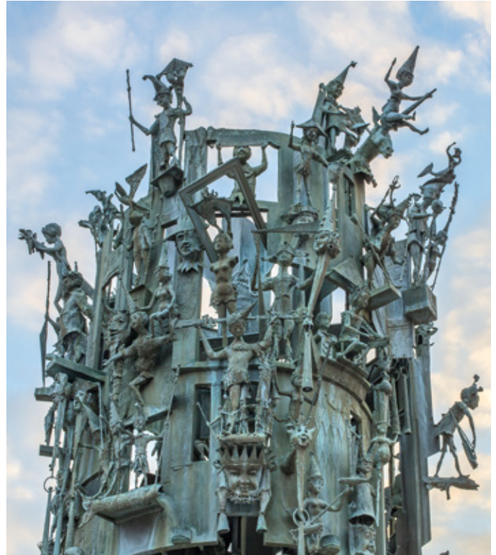
Am Schillerplatz in der Mainzer Altstadt steht das beliebte Fastnachtsdenkmal für die fünfte Jahreszeit am Rhein.

Am Rande der Altstadt befindet sich der Jakobsberg mit der Mainzer Zitadelle. Der Weg dorthin lohnt sich, wenn man die Reste der römischen Gründungszeit sehen möchte – allen voran den 20 Meter hohen Drususstein. Drusus, Stiefsohn des ersten römischen Kaisers Augustus, starb nur vier Jahre nach der Gründung des Lagers und wurde in Mogon-